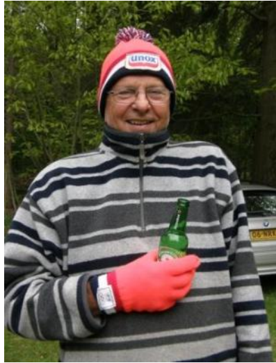
Peter pa3azn; koud he

beetje op te warmen. (van buiten door de vlammen, van binnen door de sterke drank....)